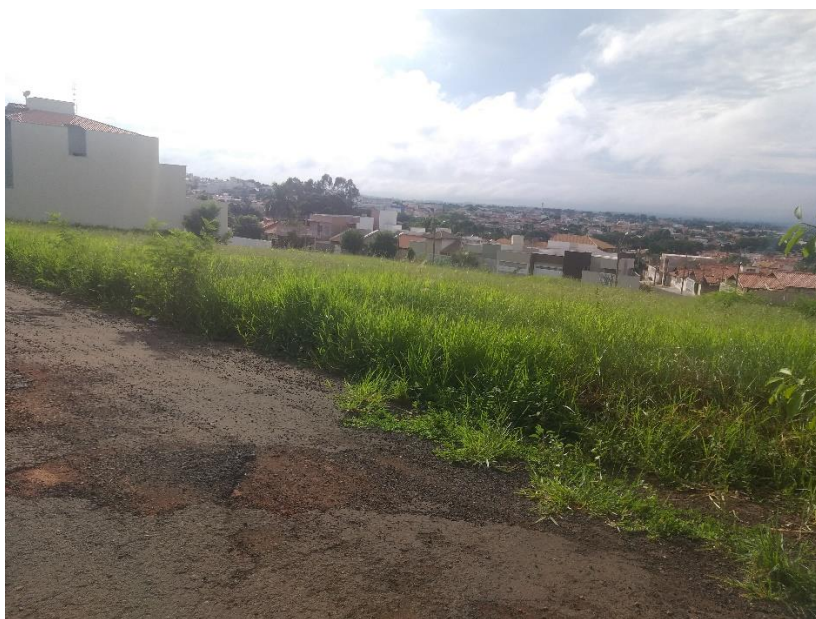
Foto do terreno com as inadequações jurídicas e administrativas e também do asfalto da rua Pedro Pêgolo com suas deteriorações.

A Prefeitura Municipal de Jales possui um grande terreno público localizado no Jardim Pêgolo II, entre as Ruas Maria Nipoti Belão e Pedro Pêgolo.