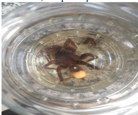
Foto de Aranha de Grande porte localizada morta no passeio público de minha casa, rua Maria Nipoti Belão, localizada de na margem do terreno da prefeitura.